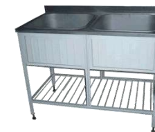
Товары народного потребления