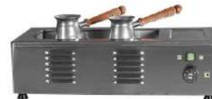
Электроаппарат для приготовления кофе на песке